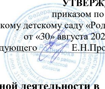
Схема распределения образовательной деятельности в разновозрастной группе «Дюймовочка» МДОУ Кругловского детского сада «Родничок» на 2024 -2025 учебный год